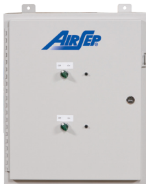
Módulo compresor de aire

El Centrox es un generador de oxígeno ideal para su uso en muchas aplicaciones. La capacidad del Centrox para suministrar una concentración de oxígeno de hasta el 95 % a flujos de hasta 0,84 Nm 3 /h o 15 L/MIN (32 SCFH) lo hacen ideal para usos comerciales que precisan hasta 345 kPa o 3,5 barg (50 psig).