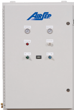
Módulo generador mediante la tecnología de PSA